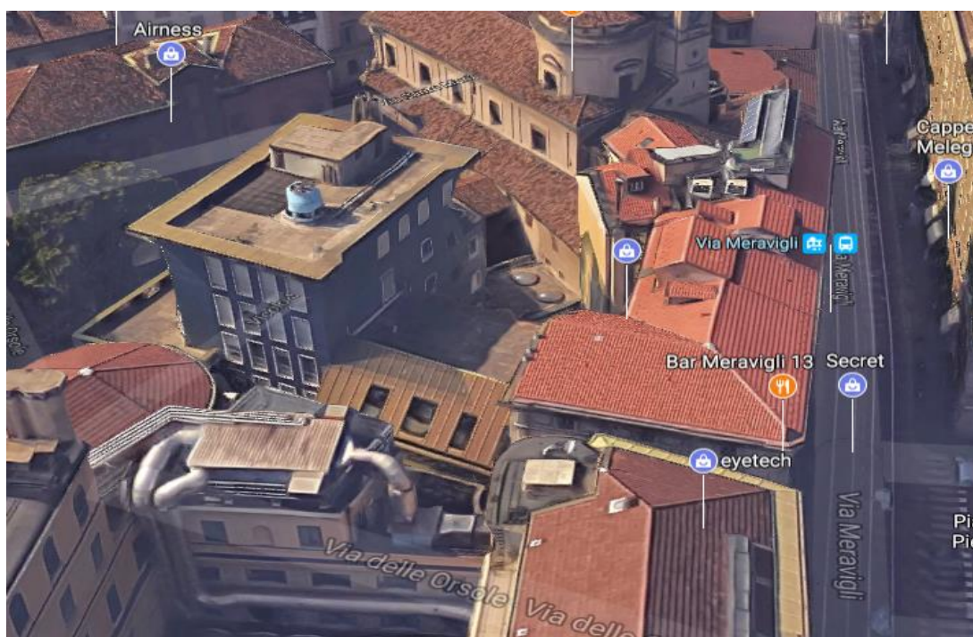
Figura 2 - vista aerea del fabbricato oggetto di intervento: Via Meravigli / via delle Orsole