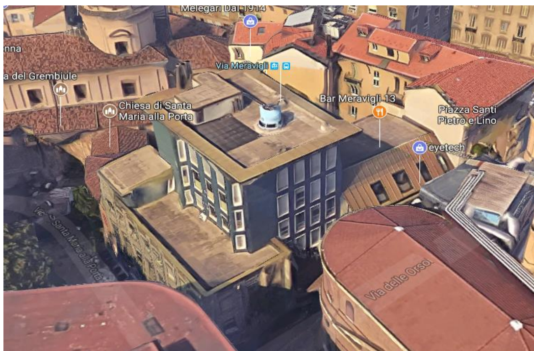
Figura 1 - vista aerea del fabbricato oggetto di intervento: Vicolo S. Maria alla Porta / Via delle Orsole; angolo sud-ovest