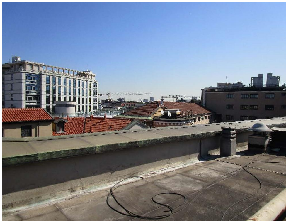
Figura 10 - vista dell'ultimo solaio