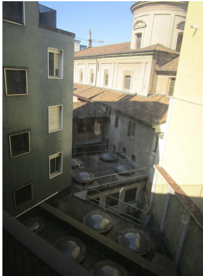
Figura 9 - scorcio del cortile interno