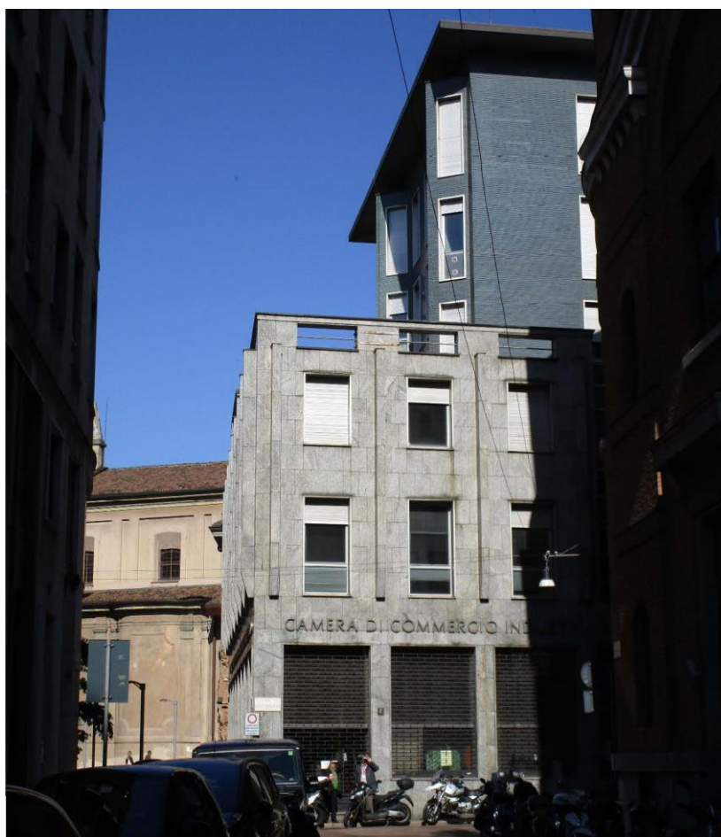
Figura 6 - scorcio del fronte occidentale dell'immobile