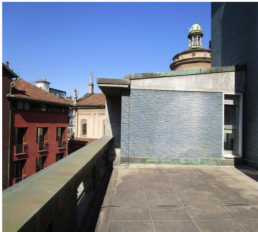
Figura 7 - scorcio basso fabbricato posto al quarto piano - affaccio verso vicolo S. Maria alla Porta