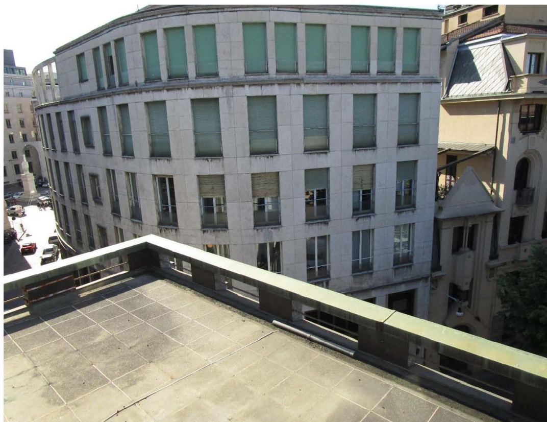
Figura 8 - scorcio terrazzo quarto piano verso Vicolo S. Maria alla Porta