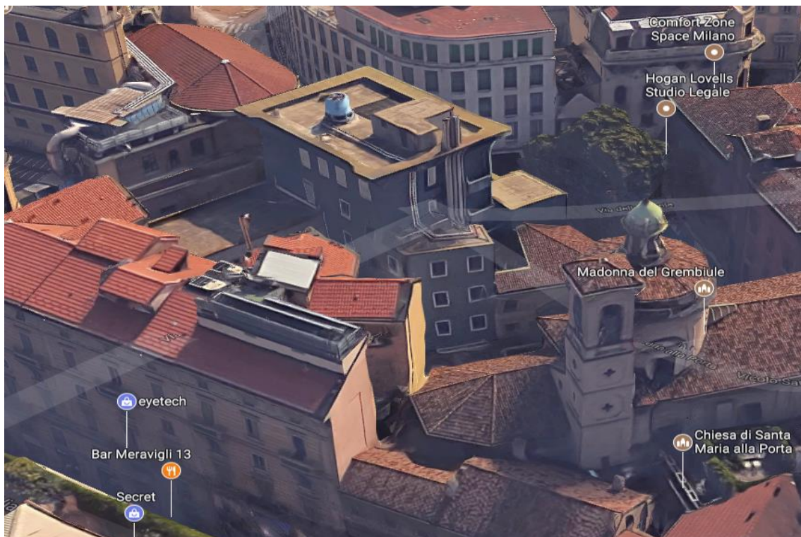
Figura 3 – vista aerea del fabbricato oggetto di intervento: Via Meravigli